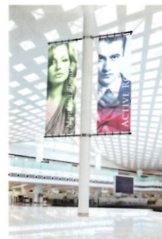
Anwendung für die TexaJet-Tinten

Maquajet DA-E-Rezeptur bündelt Marabu die Vorteile der verschiedenen Transferdruck-Technologien in einer Anwendung. Das Motiv wird ohne aufwendige Druckvorstufen im CMYK-Verfahren auf die Folie gedruckt, allein die weiße Sperrschicht er-