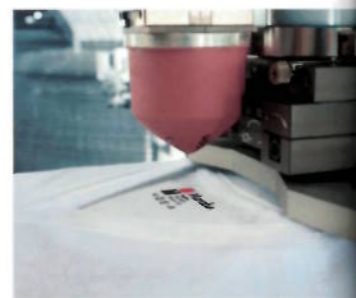
Direktdruck im Tampondruckverfahren

Neben den etablierten Sublimationstinten stellt Marabu sein neues digitales Konzept für den wasserbasierten „Cool Peel“-Transferdruck für T-Shirts vor, mit dem eine Vielzahl an Stoffarten bedruckt werden kann. Das „Cool Peel“-Transferdruckverfahren wird bisher digital sowie im Siebdruck umgesetzt. Mit der neu überarbeiteten, wasserbasierten