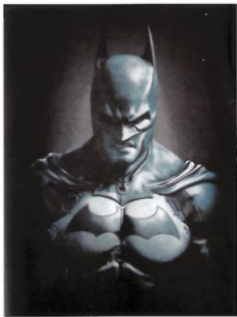
Batman gedruckt mit 105 lpi

für die Show am Samstag angefordert wurden. Sie sollten bereits am nächsten Morgen geliefert werden. Darren und sein Team kehrten um 21 Uhr zur Druckerei zurück, nahmen den Job in Angriff und um 2.30 Uhr waren die bedruckten Shirts fertig. Die Gauntlet hatte 1.150 T-Shirts pro Stunde erledigt. „Auf der alten Sportsman hätte es mehr als acht Stunden gedauert“, sagt Andy.